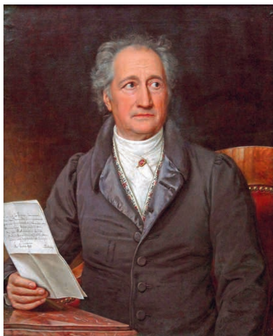
Йозеф Карл Штилер. Портрет Иоганна Вольфганга Гёте. 1828. Холст, масло. Новая пинакотека, Мюнхен