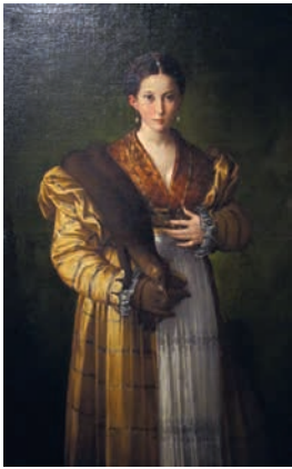
Пармиджанино. Портрет молодой женщины (Антея) . 1530-е. Холст, масло. Музей Каподимонте, Неаполь