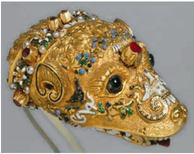
Зибеллино. Деталь. Около 1550–1559. Италия. Золото, рубины, гранаты, жемчуг, эмаль. Художественный музей Уолтерса, Балтимор