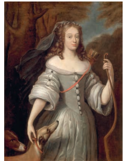
Клод Лефевр. Портрет Луизы-Франсуазы де Ла Бом Ле Блан, герцогини де Лавальер в образе Дианы. 1667. Холст, масло. Национальный музей Версаля и Трианонов

Это интересно: Многие виды завязывания галстуков появились случайно, например галстук лавальер, модный при дворе Людовика XIV, появился благодаря фаворитке короля Луизе-Франсуазе де Ла Бом Ле Блан, герцогине де Лавальер и де Вожур (1644–1710). Считается, что именно она завязала белый шейный платок с кружевом красивым бантом. А вот галстук а-ля стейнкерк вошел в моду после сражения при Стейнкерке. В 1684 году французским солдатам, поднятым ночью по боевой тревоге, было не до правильного завязывания шейных шарфов, и они просто обмотали их вокруг шеи, а концы скрутили вместе и зафиксировали в петлице камзола.