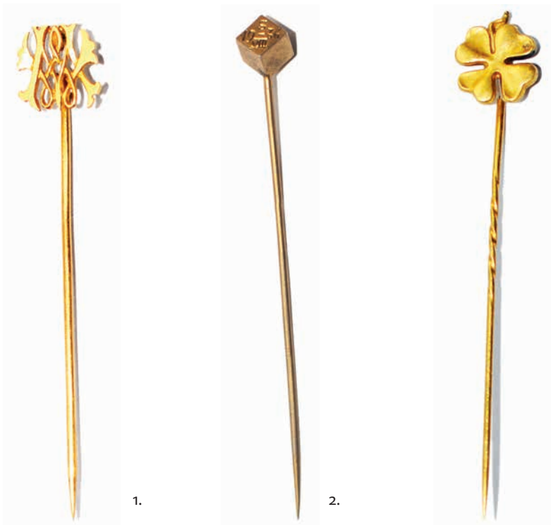
1. Булавка для галстука. Конец XIX века. Западная Европа. Золото. Частное собрание