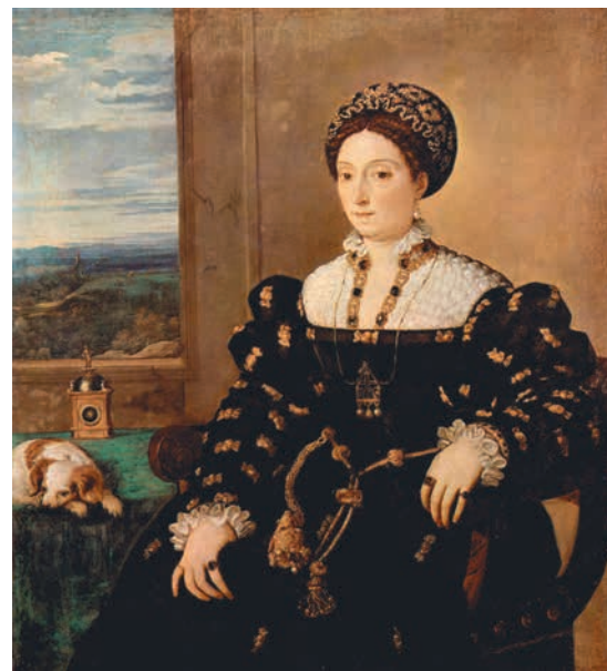
Тициан. Портрет Элеоноры Гонзаго . 1536–1538. Холст, масло. Галерея Уффици, Флоренция