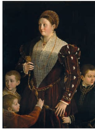
Пармиджанино. Камилла Гонзага с сыновьями . Около 1539–1540. Дерево, масло. Музей Прадо, Мадрид