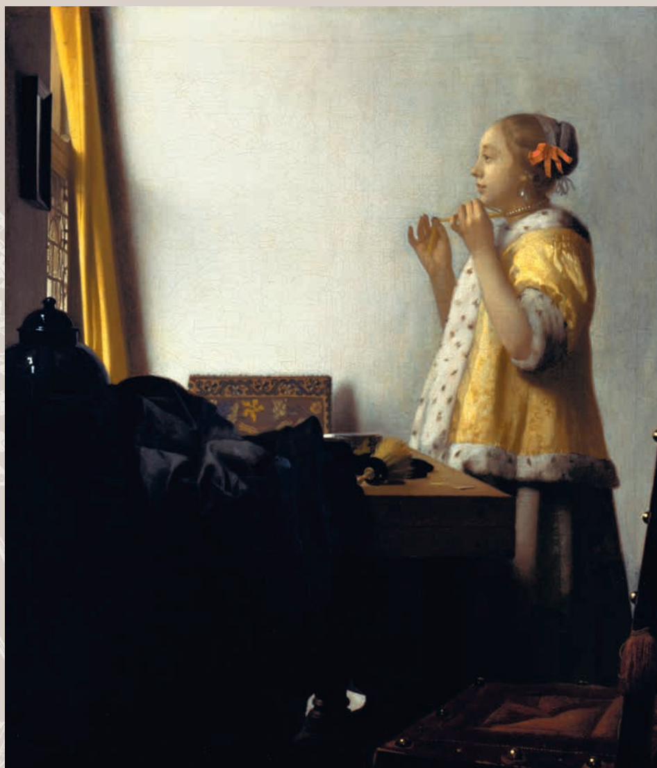
Ян Вермеер Делфтский. Женщина с жемчужным ожерельем. Около 1662–1665. Холст, масло. Картинная галерея, Берлин