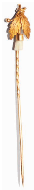
Булавка для галстука. Конец XIX века. Западная Европа. Золото, молочный зуб ребенка. Частное собрание

На протяжении всего XIX века мужчины соревнуются между собой в красоте завязанного галстука или платка. «Чтобы казаться наряженными, мужчины меняли галстуки три раза в день. Умение вывязывать