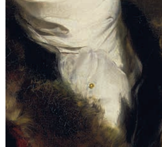
Томас Лоуренс. Портрет Джона Блумфилда . 1819. Холст, масло. Национальная портретная галерея, Лондон

бант каждый раз по-разному вызывало достойную зависть и считалось высшей ступенью совершенства. Щеголи всех стран Европы соревновались между собой в безделье и... красоте галстуков» (Захаржевская, 2005, 139–140). Модные шейные платки и галстуки изготавливались из шелка, атласа, тонкой шерсти, слегка накрахмаленного батиста, муслина. О том, как нужно завязывать галстуки и шейные платки, давали советы, писали книги, а для того, чтобы вся эта красота не распалась, использовали булавки для галстуков, которые рекомендовали прикалывать примерно в двух дюймах (около 5 см) от узла.