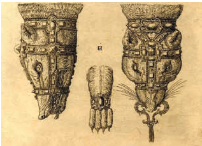
Зибеллино. Эскиз. 1562. Германия. Рисунок. Британский музей, Лондон

Зибеллино (от итал. zibellino – соболь) – это хорошо выделанные звериные шкурки, лапы и морды которых инкрустированы золотом и драгоценными камнями. Историки предполагают, что зибеллино появился в Северной Италии. Первым письменным упоминанием о зибеллино является перечень вещей герцога Бургундии Карла Смелого от 1467 года, в нем упоминается о шкурке куницы, «что накидывается на плечи, с головой и лапами из золота и с глазами из рубинов». В конце XV века зибеллино входит в моду и на протяжении всего XVI века является одним из самых дорогих и желанных подарков на территории всей Европы. С помощью зибеллино подчеркивали статус и богатство. Поэтому неудивительно, что на портретах того времени модницы из различных уголков Европы запечатлены с этим модным аксессуаром.