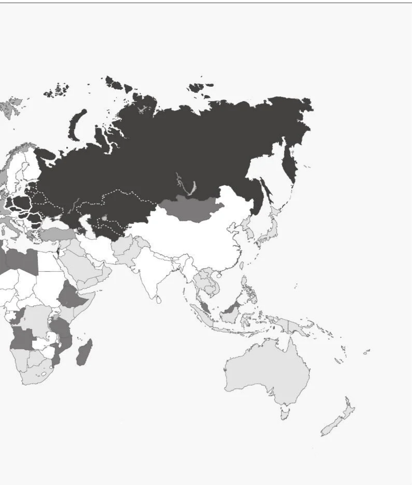
Мир в эпоху холодной войны (1980).